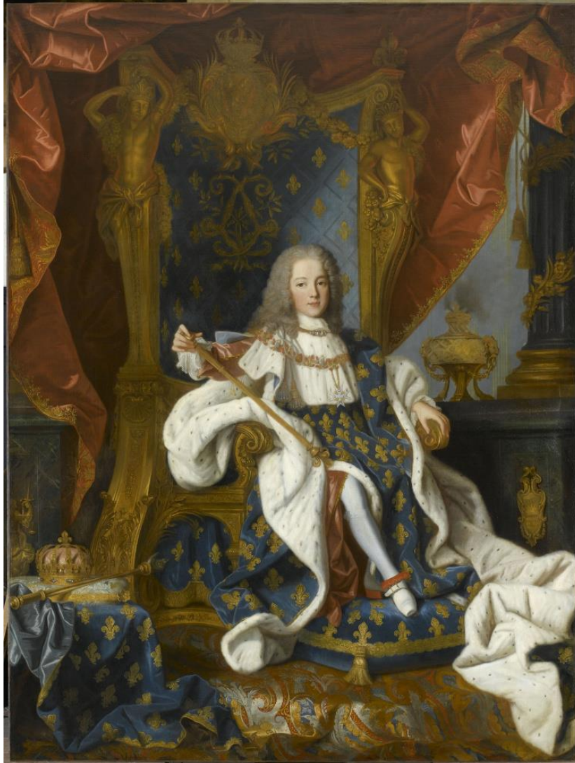
Jean RANC (1674-1735), Portrait de Louis XV , 1719, huile sur toile, 226 x 168 cm, Versailles, Musée national du château

Fiche pédagogique (histoire, niveau collège-lycée)